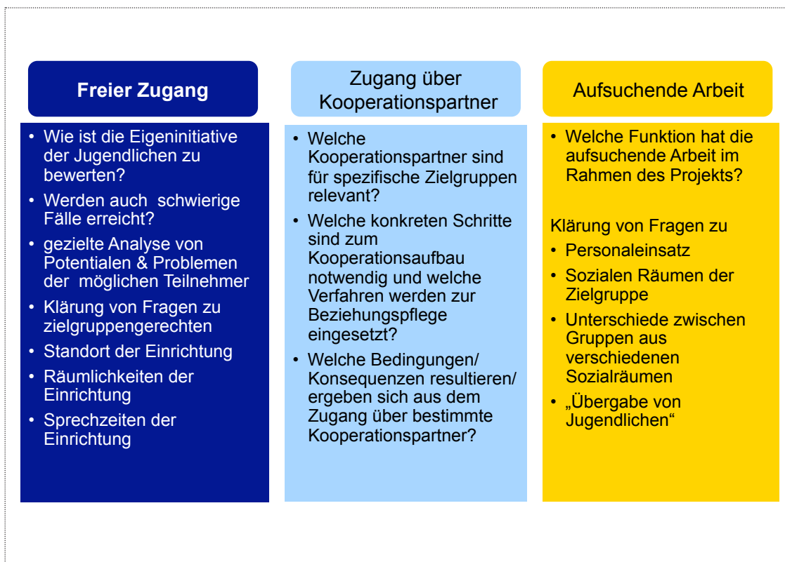
Abb. 5: Systematische Auseinandersetzung mit Zugangswegen

stützen die Kooperation zwischen Koordinierungsstellen und Schulen bzw. Lehrkräften an Schulen.